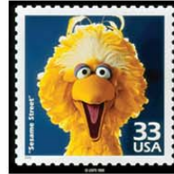
children's television workshop